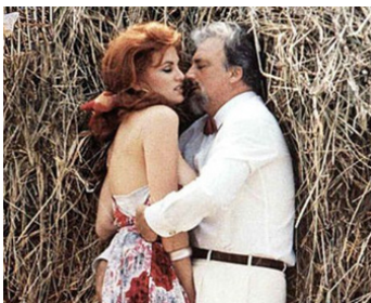
1985 MIRANDA (Miranda) de Tinto Brass avec Serena Grandi