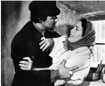
1958 POLIKOUCHKA (Polikuschaka) de Carmine Gallone avec Antonella Lualdi