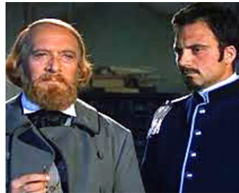
1960 VIVE L'ITALIE (Viva l'Italia) de Roberto Rossellini avec Renzo Ricci