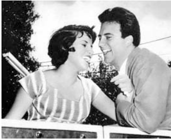
1956 NOS PLUS BELLES ANNÉES (I giorni più belli) de Mario Mattoli avec Antonella Lualdi