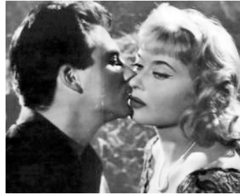
1956 TOTÒ, PEPPINO E I FUORILEGGE de Camillo Mastrocinque avec Dorian Gray