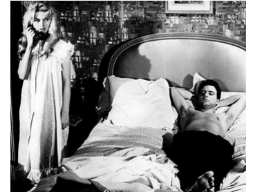
1958 EN CAS DE MALHEUR de Claude Autant-Lara avec Brigitte Bardot