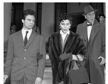
1954 LA COMTESSE AUX PIEDS NUS de Joseph L. Mankiewicz avec Ava Gardner, H. Bogart