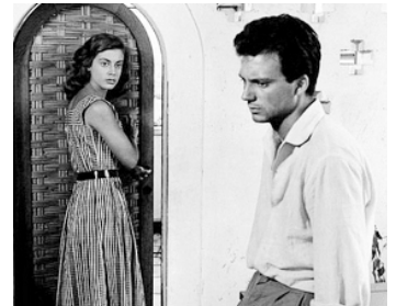
1952 CHANSONS DU DEMI-SIÈCLE (Canzoni di mezzo secolo) de D. Paolella avec A-M. Ferrero