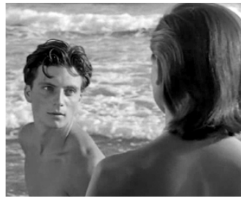
1949 DIMANCHE D'AOÛT (Domenica d'agosto) de Luciano Emmer avec Anna Baldini