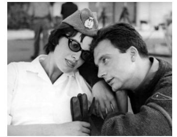
1955 ALTAIR (Altair, primo amore) de Leonardo Di Mitri avec Antonella Lualdi