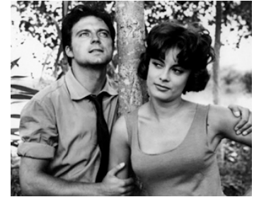
1959 LES GARÇONS (La notte brava) de Mauro Bolognini avec Anna-Maria Ferrero