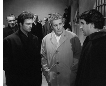
1959 LE GÉNÉRAL DELLA ROVERE (Il generale della Rovere) de Roberto Rossellini