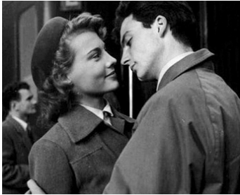
1951 PARIS EST TOUJOURS PARIS (Parigi è sempre Parigi) de Luciano Emmer avec Hélène Rémy