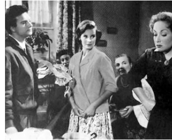
1956 PÈRE ET FILS (Padri e figli) de Mario Monicelli avec Antonella Lualdi, Marisa Merlini