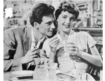
1952 DON LORENZO (La Canzone della Vita) de Carlo L. Bragaglia avec Rossana Podesta