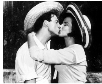
1955 LES AMOUREUX (Gli innamorati) de Mauro Bolognini avec Antonella Lualdi