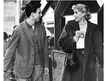
1952 LES ANGES DÉCHUS (Il Mondo le condanna) de Gianni Franciolini avec Claude Nollier