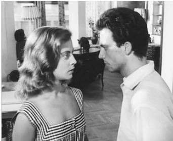
1952 LES VAINCUS (I Vinti) de Michelangelo Antonioni avec Anna-Maria Ferrero