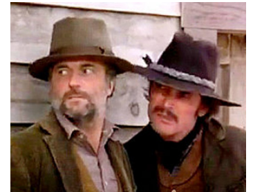
1978 CLAYTON & CATHERINE (China 9, Liberty 37) de M. Hellman avec Carlos Bravo