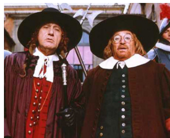
1989 L'AVARE (L'Avaro) de Tonino Cervi avec Alberto Sordi