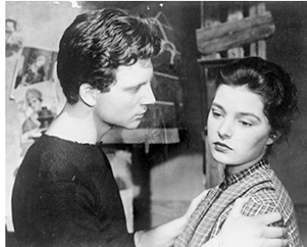
1952 LES COUPABLES (Processo al Città) de Luigi Zampa avec Silvana Pampanini