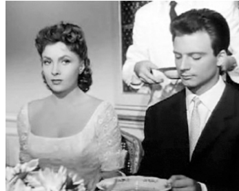
1952 LA MARCHANDE D'AMOUR (La Provinciale) de Mario Soldati avec Gina Lollobrigida