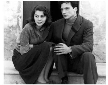
1951 TERESA (Teresa) de Fred Zinnemann avec Anna-Maria Pierangeli