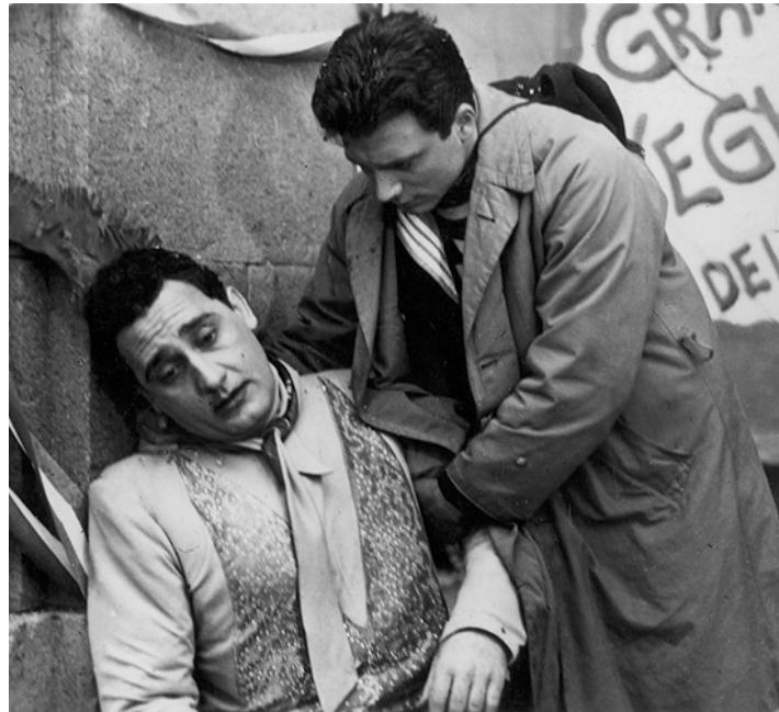
1953 LES VITELLONI ou LES INUTILES (I Vitelloni) de Federico Fellini avec Alberto Sordi