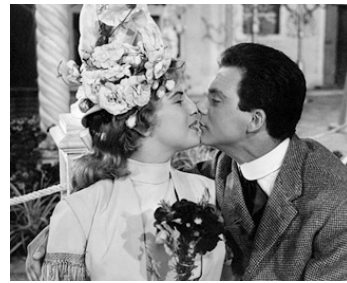
1950 SIGNORINELLA (Signorinella) de Mario Mattoli avec Antonella Lualdi