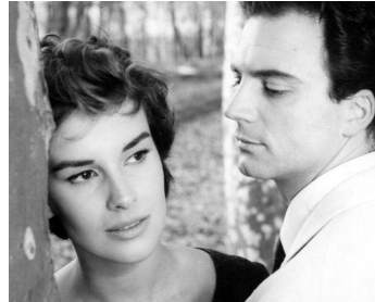
1957 JEUNES MARIS (Giovanni Mariti) de Mauro Bolognini avec Antonella Lualdi