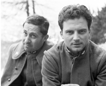
1957 L'ADIEU AUX ARMES (A Farewell to Arms) de Charles Vidor avec Leopoldo Trieste