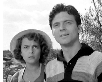
1951 LE PETIT MONDE DE DON CAMILLO de Julien Duvivier avec Vera Talchi