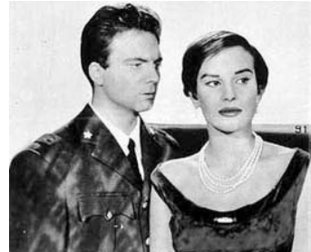
1957 LE CIEL BRÛLE (Il Cielo brucia) de Giuseppe Masini avec Antonella Lualdi