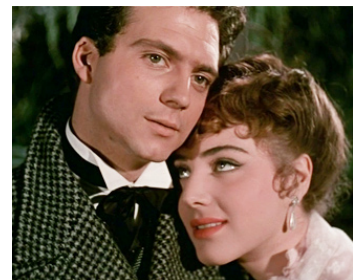
1953 AMOURS D'UNE MOITIÉ DE SIÈCLE (Amori di mezzo secolo) de G. Pelligrini avec Lea Padovani