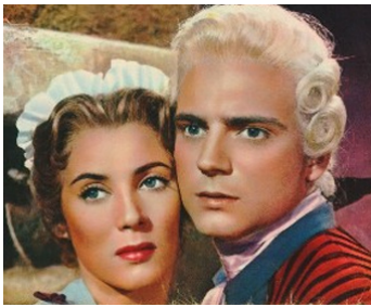
1954 LES DEUX ORPHELINES (Le due Orfanelle) de Giacomo Gentilomo avec Myriam Bru