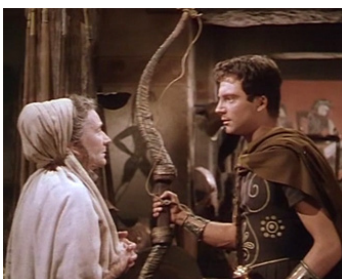
1953 ULYSSE (Ulisse) de Mario Camerini et Edgar G. Ulmer avec Sylvie